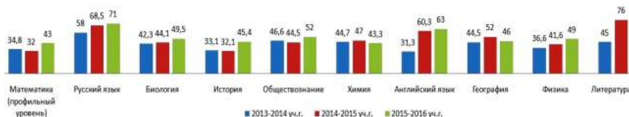
Рис.3 Сравнительные результаты ЕГЭ в 2014-2016 учебных годах

По результатам государственных экзаменов учащиеся по основным предметам имеют стабильно высокие результаты (см. рис.4). Результаты сдачи ЕГЭ имеют положительную динамику (см. рис.3). За последние 2 года 10 выпускников награждены медалью «За особые успехи в обучении». В 2014-2015 учебном году выпускница набрала 100 баллов по литературе. Более 80% выпускников продолжают обучение в высших учебных заведениях Тульской области, Москвы, Санкт-Петербурга, Рязани, Воронежа.