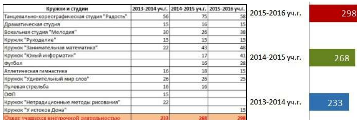
Рис.5. Охват учащихся внеурочной деятельностью

В ОУ ведется системная работа по выявлению одаренных детей. Увеличивается количество учащихся, вовлеченных в дополнительное образование ( см. рис.5).