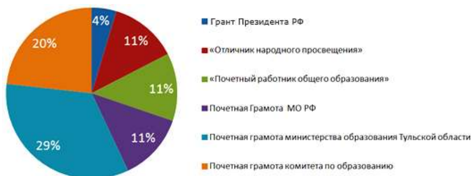
Рис.2 Награждённые педагоги (процент от общего количества)

Педагогический состав: 40 педагогов (42% - высшая категория имеют-31% - первая категория, см. рис.2). В школе сформировался высокопрофессиональный педагогический коллектив, имеющий опыт организации внеурочной работы, проектной и исследовательской деятельности. Учителя регулярно участвуют в подготовке и проведении региональных и муниципальных педагогических мастерских.